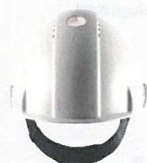
Zeigt an, wann der Helm ausgetauscht werden muss.