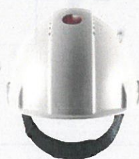
Technisch kalibriert und getestet