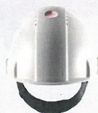
Funktioniert weltweit in den meisten Umgebungen