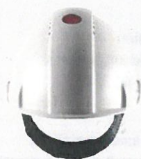
Misst die UV-Strahlungsexposition

Die korrekte Funktion des Uvicator Sensor ist nur dann gewährleistet, wenn die Scheibe frei von Aufklebern, u.ä. Etiketten bleibt.