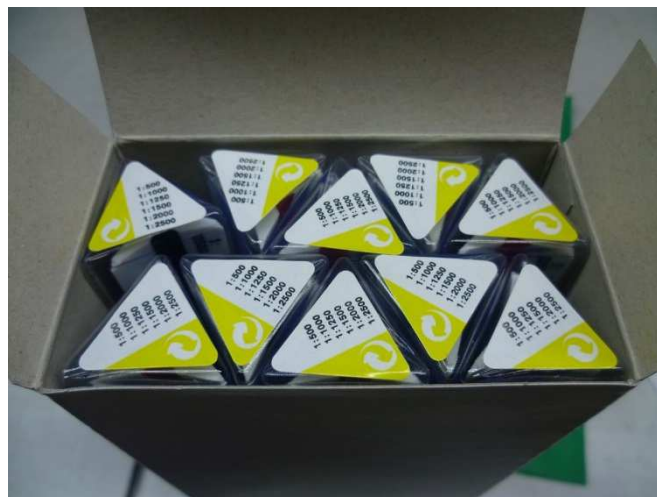
Kennzeichnung der Köcher